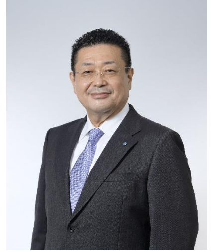
Kurita Water Industries Ltd. Başkan ve İcra Kurulu Temsilcisi